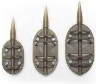
Flat Method Feeder