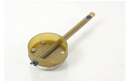
Banjo Feeder Elasticated