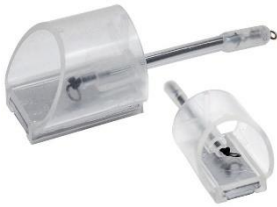
Pellet Feeder Elasticated