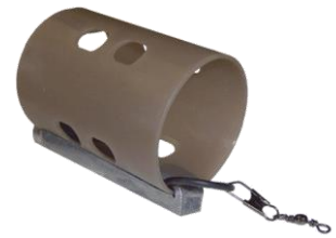
Open End Feeder